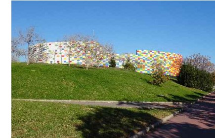
Palau de la Festa