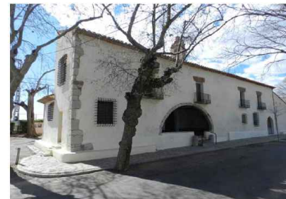
Ermita de Sant Jaume de Fadrell