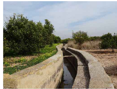
Sèquia de Vinamargo