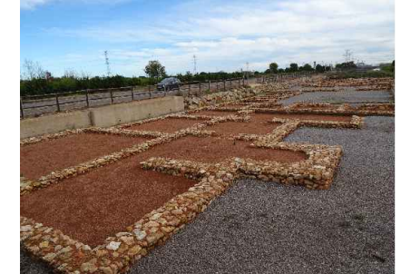
Villa romana del Camino de Vinamargo