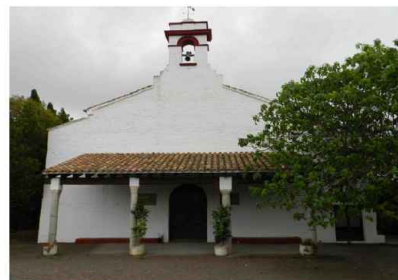
Ermita de Sant Isidre i Sant Pere