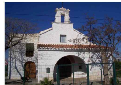
Ermita de Sant Josep