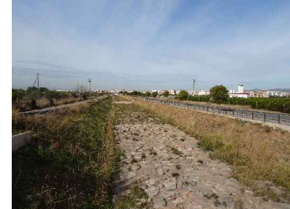
Barranc de Fraga