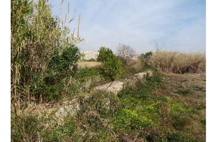
Àrea visualment sensible