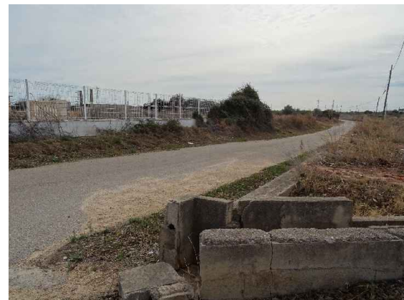
Camí de Sant Josep