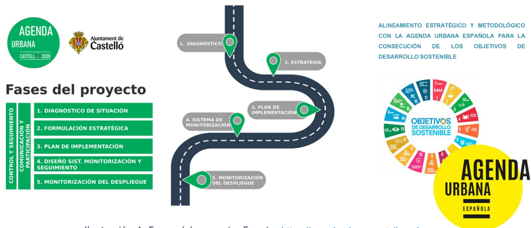
Ilustración 1. Fases del proyecto.

En una primera fase se elaboró un Diagnóstico participado del municipio , el cual se concreta tomando como base el decálogo de Objetivos Estratégicos de la AUE. De esta forma, se dota a todo el proceso de elaboración de la AU Castelló 2030, de coherencia y trazabilidad, desde su fase de análisis y diagnóstico, hasta el Plan de Acción.